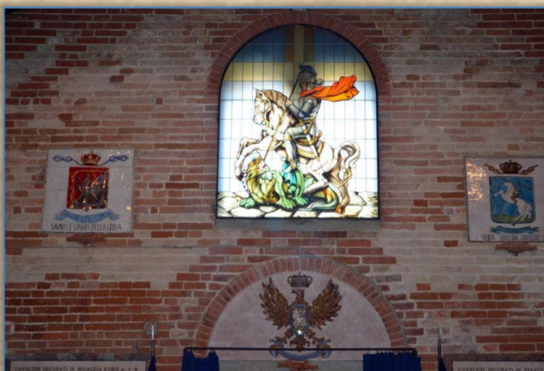
La vetrata posizionata

L'effetto della nuova vetrata è notevole, anche se fortemente condizionato dall'incidenza dei raggi del sole sulla facciata del Tempio: quando, infatti, la luce è più diretta, l'ombra della struttura della bifora oscura la parte centrale della vetrata.