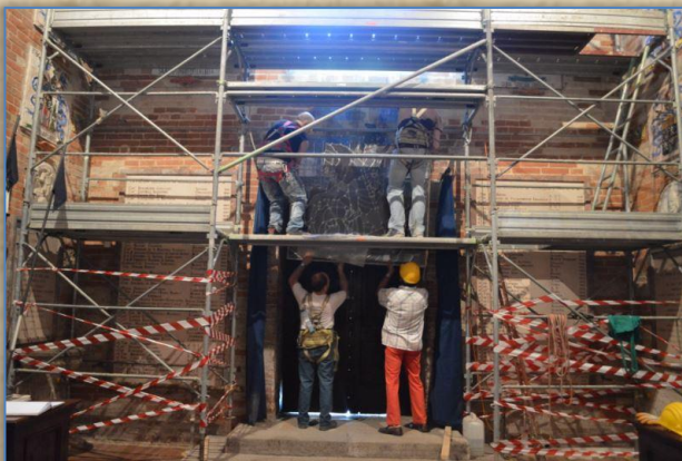
Operazioni per la posa della vetrata