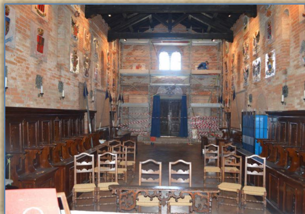
La bifora senza vetrata

Nelle more della realizzazione, poiché il costo della vetrata ammonta a ben 6.100 euro, il Priore lancia fra i Patroni ed i Cavalieri una sottoscrizione. La risposta è stata anche superiore alle aspettative: ad oggi ben 47, tra Cavalieri, simpatizzanti, patroni ed amici hanno contribuito facendo superare di poco i 4.000 euro. La sottoscrizione rimarrà attiva ancora tutto l'anno nella speranza che altri benefattori vogliano unirsi e coprire così quanto ancora mancante.