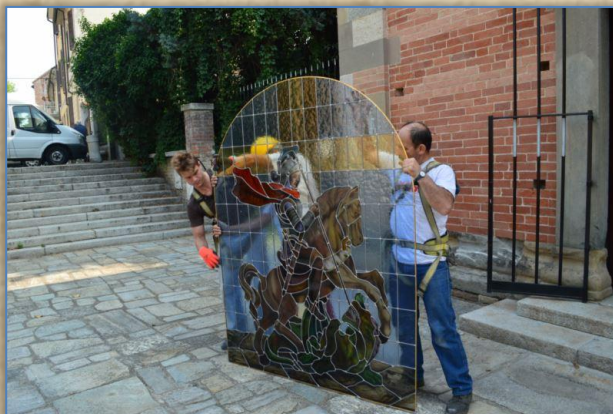
L'arrivo della nuova vetrata