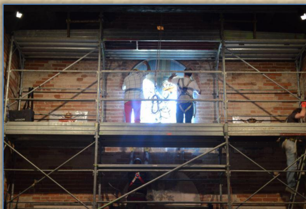
La nuova vetrata viene sigillata